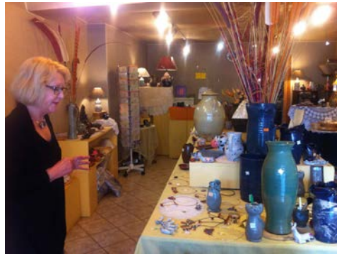
Г-ѓа Хасан: грнчарство