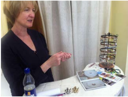
Катрин Марки: дизајн и изработка на накит